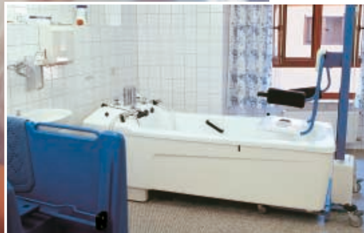
Blick in ein Bad. Die alten- und behindertengerechte Ausstattung lässt nichts zu wünschen übrig.